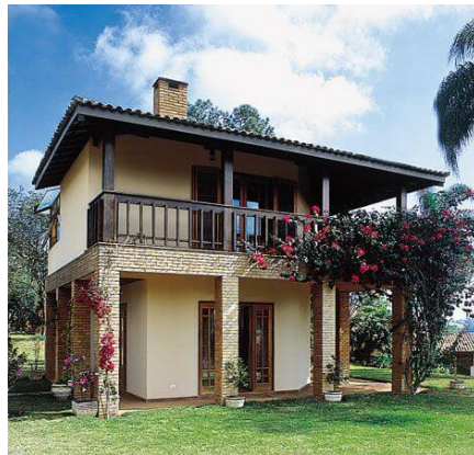
CASA DE ALVENARIA