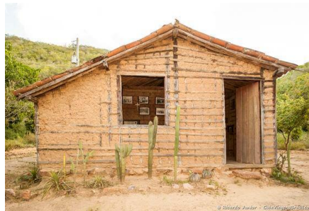
CASA DE PAU A PIQUE