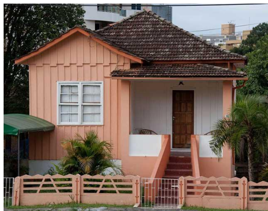
CASA DE MADEIRA